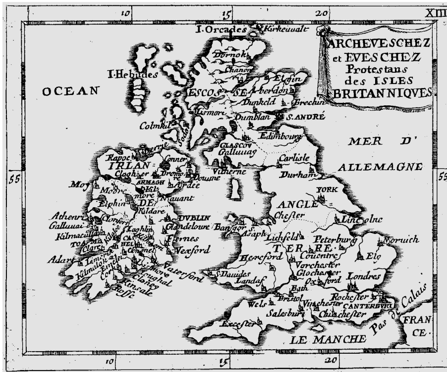
J.A.L. Franks & Co.

The inclusion of this atlas in his printed catalogue of 1672 means it must be dated prior to then. It has been tentatively assigned to 1664, that is soon after he was resident at the address on the titlepage. The New York State Library copy is said to have a colophon dated 1654 which is presumably a misprint, quite possibly for 1664. It was later reissued bound with Petites tables généalogiques .